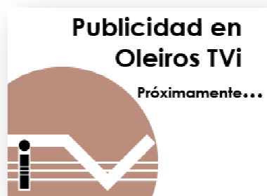
Imagen rectangular 250x180 (móviles)